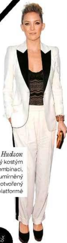
Kate Hudson Kalhotový kostým v černobílé kombinaci, dokonale umírněný model dotvořený lodičkami na platformě

Nejprve přichází inspirace, pak následuje její UVEDENÍ DO SVĚTA MÓDY.