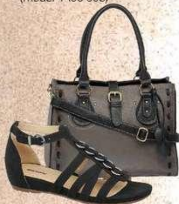
Římské sandály, Graceland, 549 Kč (model 1 210 469), od poloviny dubna