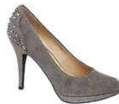
Lodičky, Graceland, 899 Kč (model 1 174 670)