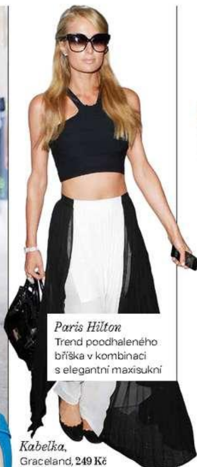
Paris Hilton Trend poodhaleného břicha v kombinaci s elegantní maxisukni