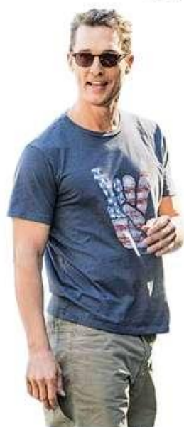
Matthew McConaughey Ten, který si umí užít volného času, nosí pochopitelně barevné tenisky