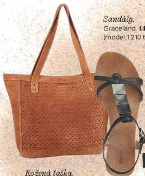
Kožená taška, 5th Avenue, 799 Kč (model 4 110 663), od konce dubna