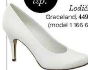
Lodičky, Graceland, 449 Kč (model 1 166 622)