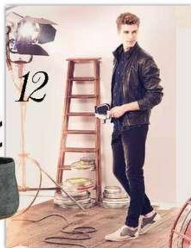
Šněrovací obuv, Graceland, 599 Kč (model 1 144 654)