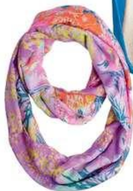
Šála, Deichmann, 199 Kč (model 4 690 612)