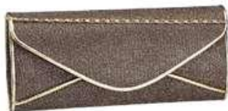
Kabelka, Graceland, 249 Kč (model 4 100 502), dostupné také v černé barvě