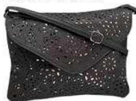
Kabelka, Graceland, 249 Kč (model 4 100 607), dostupné také v bílé a červené barvě, od konce května