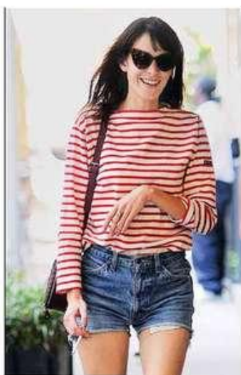
Alexa Chung Baleríny k šortkám a pruhovanému tričku jsou optimální letní outfit