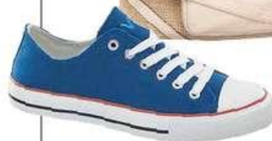
Tenisky, Vty, 299 Kč (model 1 717 643)