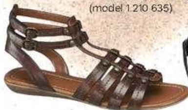
Sandály, Graceland, 549 Kč (model 1 210 635)