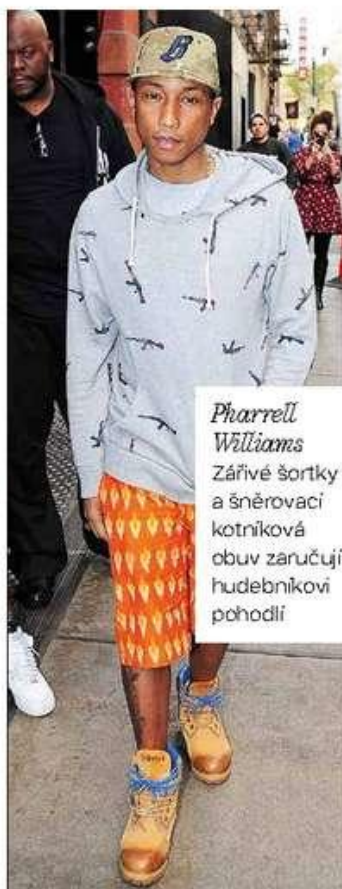
Pharrell Williams Zářivé šortky a šněrovací kotníková obuv zaručují hudebníkovi pohodlí