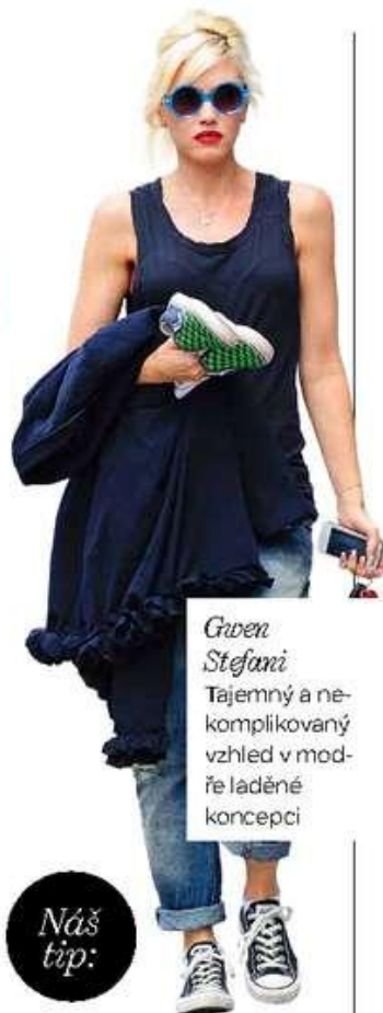
Gwen Stefani Tajemný a nekomplikovaný vzhled v modře laděné koncepci