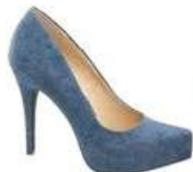
Lodičky, Graceland, 549 Kč (model 1 174 801)