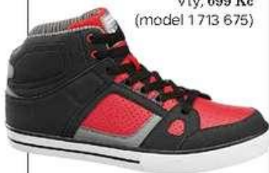
Kotníkové tenisky, vty, 899 Kč (model 1 713 675)