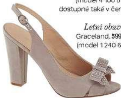
Letní obuv, Graceland, 599 Kč (model 1 240 625)