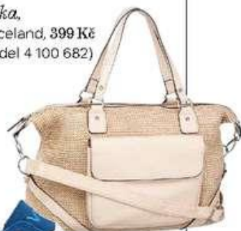
Taška, Graceland, 399 Kč (model 4 100 682)