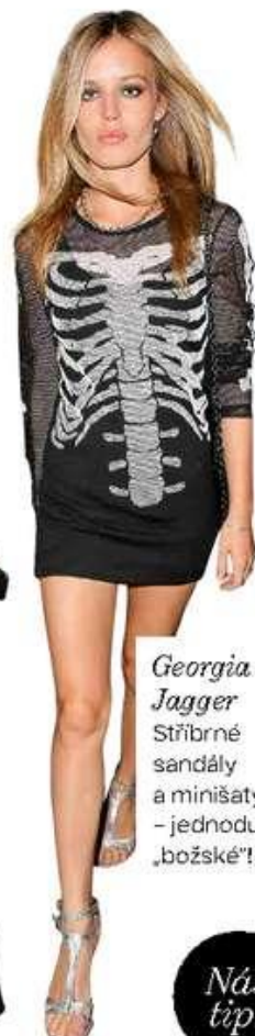
Georgia May Jagger Stříbrné sandály a minišaty – jednoduše „božské“!