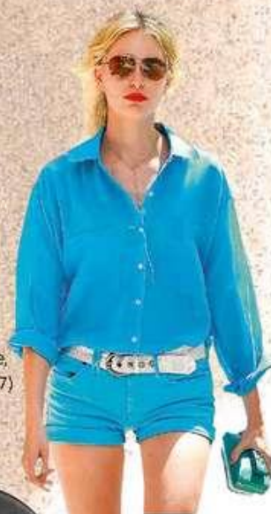
Karolína Kurková Modelka je nepřehlédnutelná v zářivé azurové barvě, stříbrných sandálech a s výraznými rty.