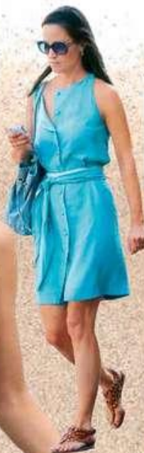
Pippa Middleton Nízké sandály s nýty a letní šaty, elegantní navzdory teplotě 30 stupňů!

V soukromí nechává tato celebrita své lodičky s vysokým podpatkem ve skříni. Při 4 dětech jsou nezbytné letní sandály a maxi šaty.