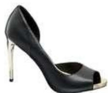
Lodičky s otevřenou špičkou, Catwalk, 799 Kč (model 1 185 620)