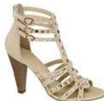
Obuv v římském stylu, Graceland, 899 Kč (model 1 174 610), od poloviny dubna