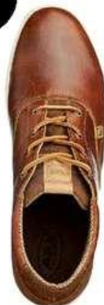
Kotníková obuv, AM Shoes, 1799 Kč (model 1 314 641)