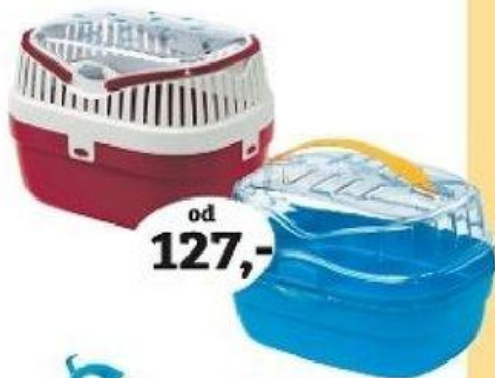
TRANSPORTNÍ BOXY pro drobné savce různé druhy