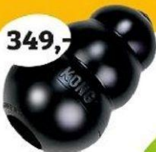
GUMOVÝ GRANÁT EXTREME pro silné kousáče